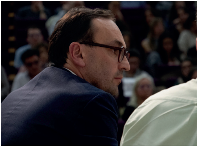
Thomas Cazenaves au débat du BDM de Sciences Po Bordeaux le 5 mars.

Le 22 mars dernier, Thomas Cazenave est élu maire de Bordeaux avec 50,95% des voix, face au maire écologiste sortant - et alumni de Sciences Po Bordeaux - Pierre Hurmic. L'occasion pour l'InsPo de regarder ce qu'a prévu l'élu Renaissance, soutenu par une dizaine de partis du centre et de la droite, pour les près de 80 000 jeunes que