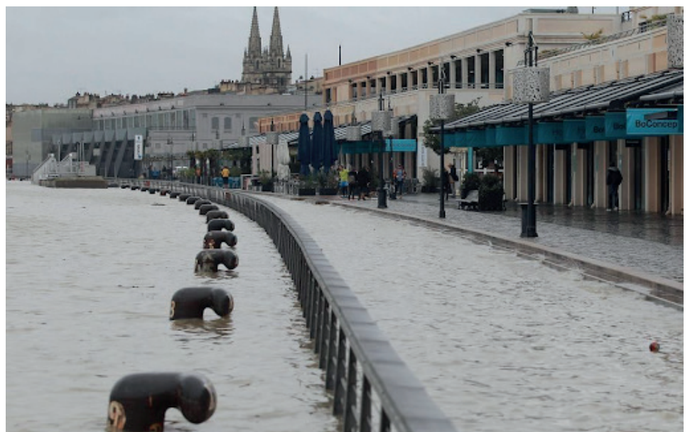
Le quai de Bacalan inondé