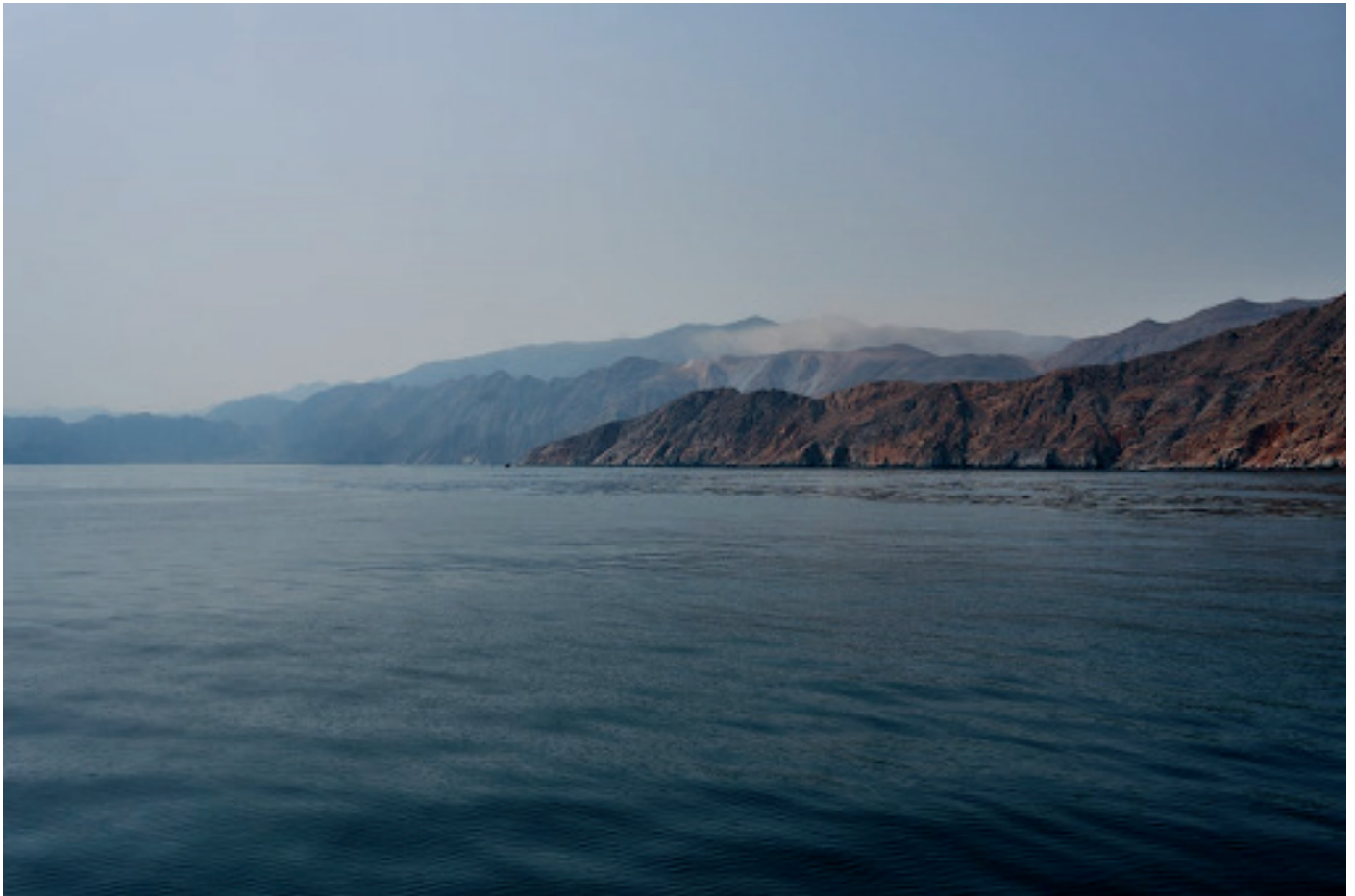
Le détroit d'Ormuz

La guerre qui fait rage en Iran est-elle un énième coup de tête de Donald Trump, ou s'inscrit-elle dans une réelle stratégie de disruption économique ? Derrière le conflit, une tendance mondiale transparait : l'arsenalisation des interdépendances.