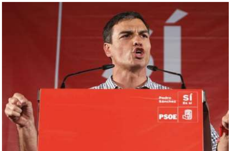
Pedro Sánchez, candidat socialiste à l'investiture

Des rapprochements mécaniques s'opèrent alors. Si l'alliance de Sumar (gauche progressiste) et du PSOE ne surprend personne (les deux partis gouvernent ensemble depuis des années), celle que tente de nouer le PP a de quoi étonner. L'Espagne