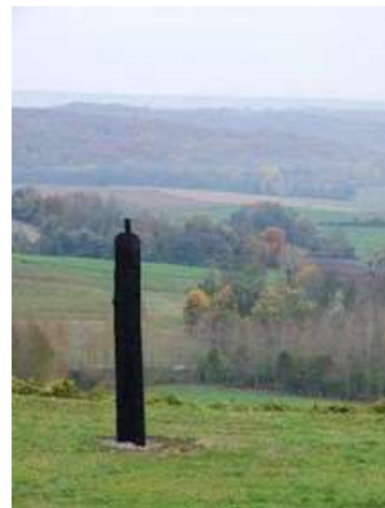
« Constellation de la douleur » Monument hommage aux sénégalais tombés sur le Chemin des Dames

min des Dames et des régiments de harkis. Ceux qui avaient cru voir en la France, cette terre de valeurs et d'espoir, emprise d'égalité, de respect et de prospérité. Ceux qui aussi ne l'avaient pas cherché mais que la France est venu arracher de force à leurs terres natales. Ceux qui en ont été déçu, délaissé, jeté lorsqu'on avait plus besoin d'eux, mais sans qui rien n'aurait été possible. Ceux qui par leur présence ont donné à notre pays son charme et sa couleur plurielle. Ceux à qui, dans leur postérité, la France doit réparation. Réparation mémorielle, excuses publiques, rien de plus, rien de moins.