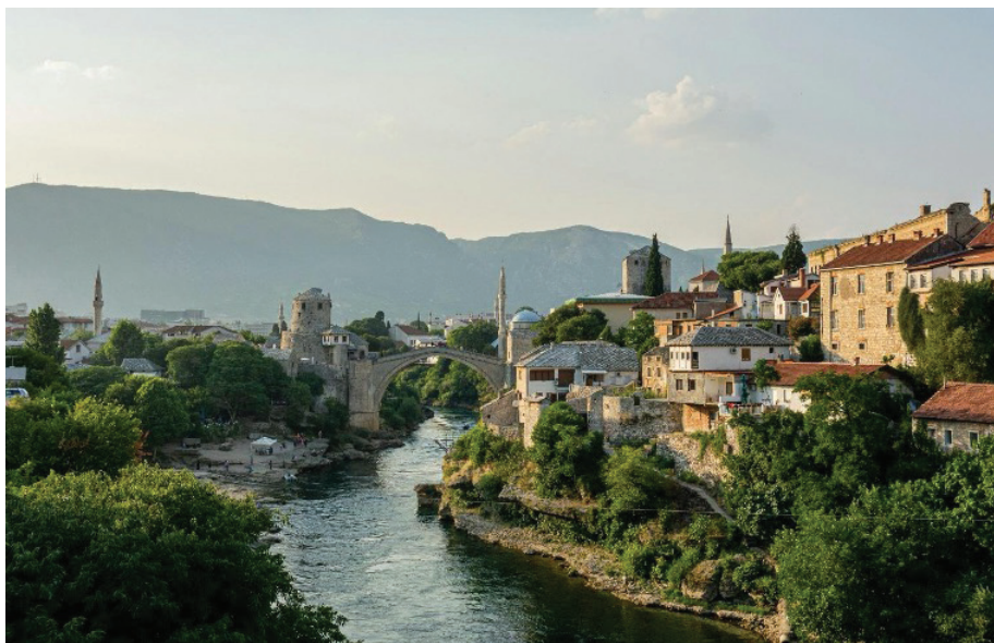
Mostar, ville croato-bosniaque où coexistent églises et minarets.