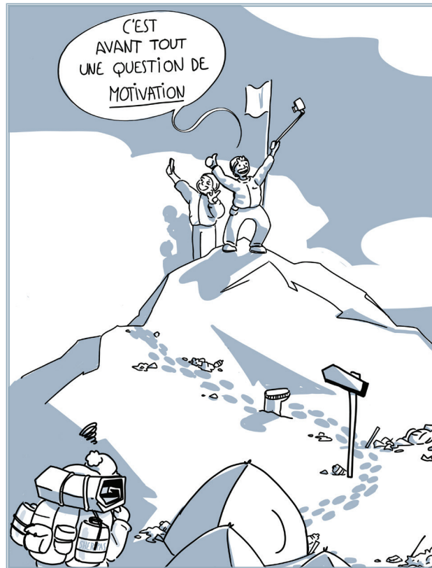
Illustration : Elsa

Ignorer la catastrophe climatique, l'inaccessibilité d'un tel projet, et la loi, il y a mieux comme inspiration à donner à 8 millions d'abonnés.