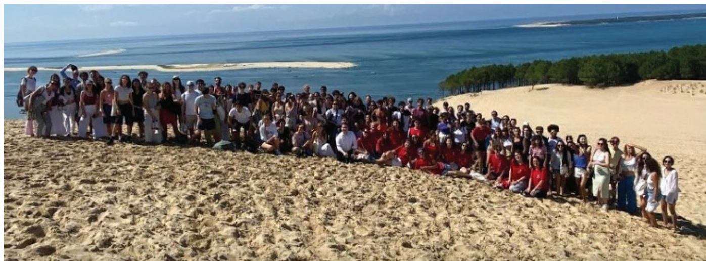
Les étudiants erasmus sur la Dune du Pilat.