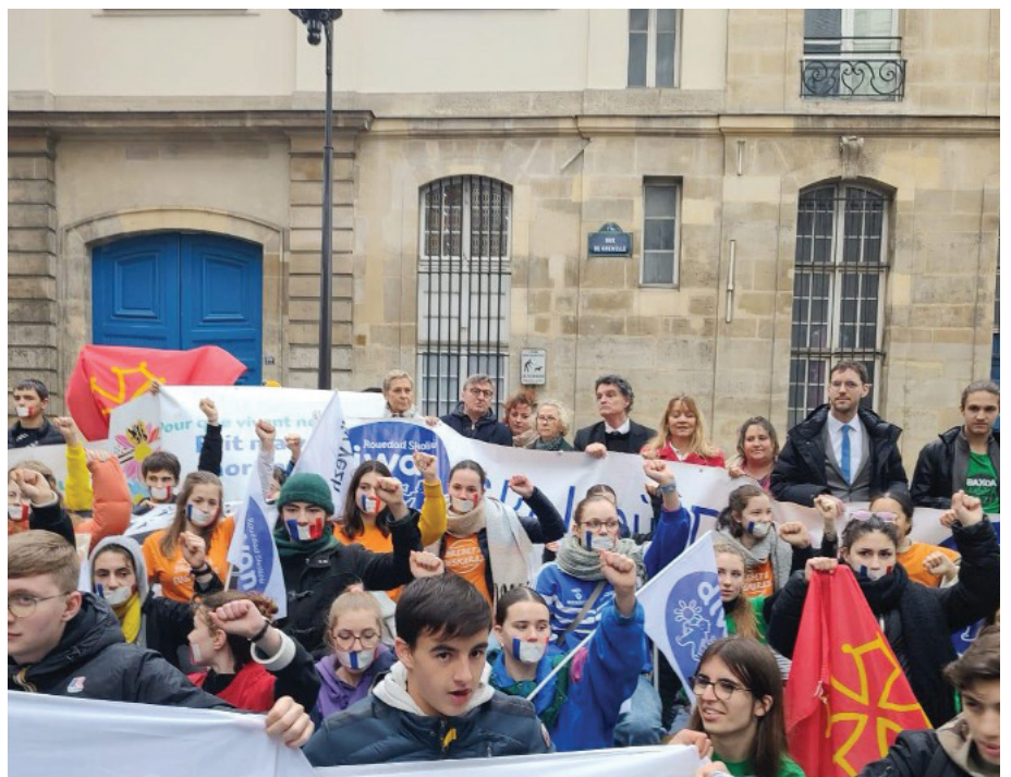
Rassemblement de lycéens organisé par le collectif Pour que vivent nos langues pour la reconnaissance des langues régionales à l'école, Paris, Février 2024.

Aujourd'hui, l'enseignement des langues régionales en France reste largement marginalisé. La loi Molac de 2021, sur la préservation des langues régionales, faisait de l'éducation l'un de ses