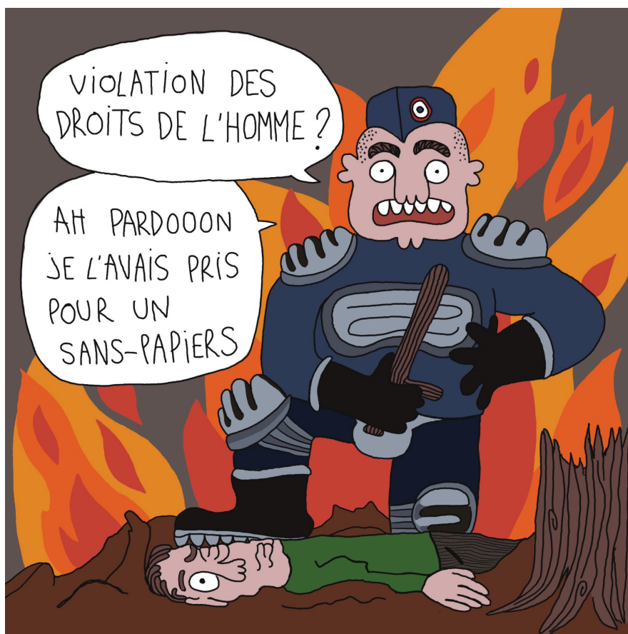
Illustration : Paul Klein