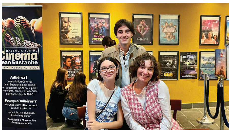
Accueil par les membres du bureau des Petits Courts.

Au-delà d'un voyage entre deux pays, le film aborde des thématiques aussi variées que la difficulté des rapports familiaux, le harcèle-