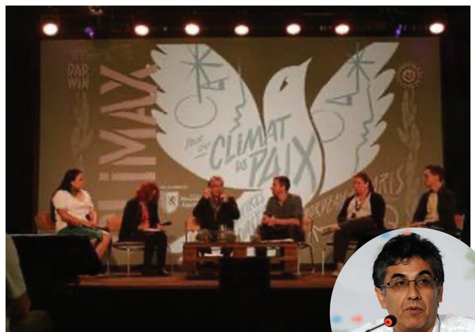
Table ronde "Cultiver la Paix : le Buen Vivir face au modèle extractiviste" (festival Climax)