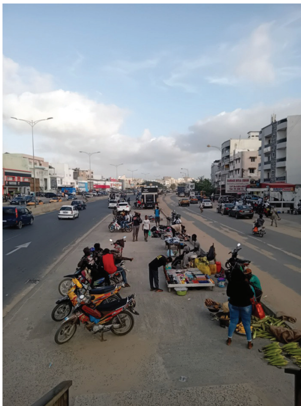
Yoff et ses commerçants de rue. Crédit : L'InsPo.

NDLR : L'intégralité de l'article est à retrouver sur le site du BDM.