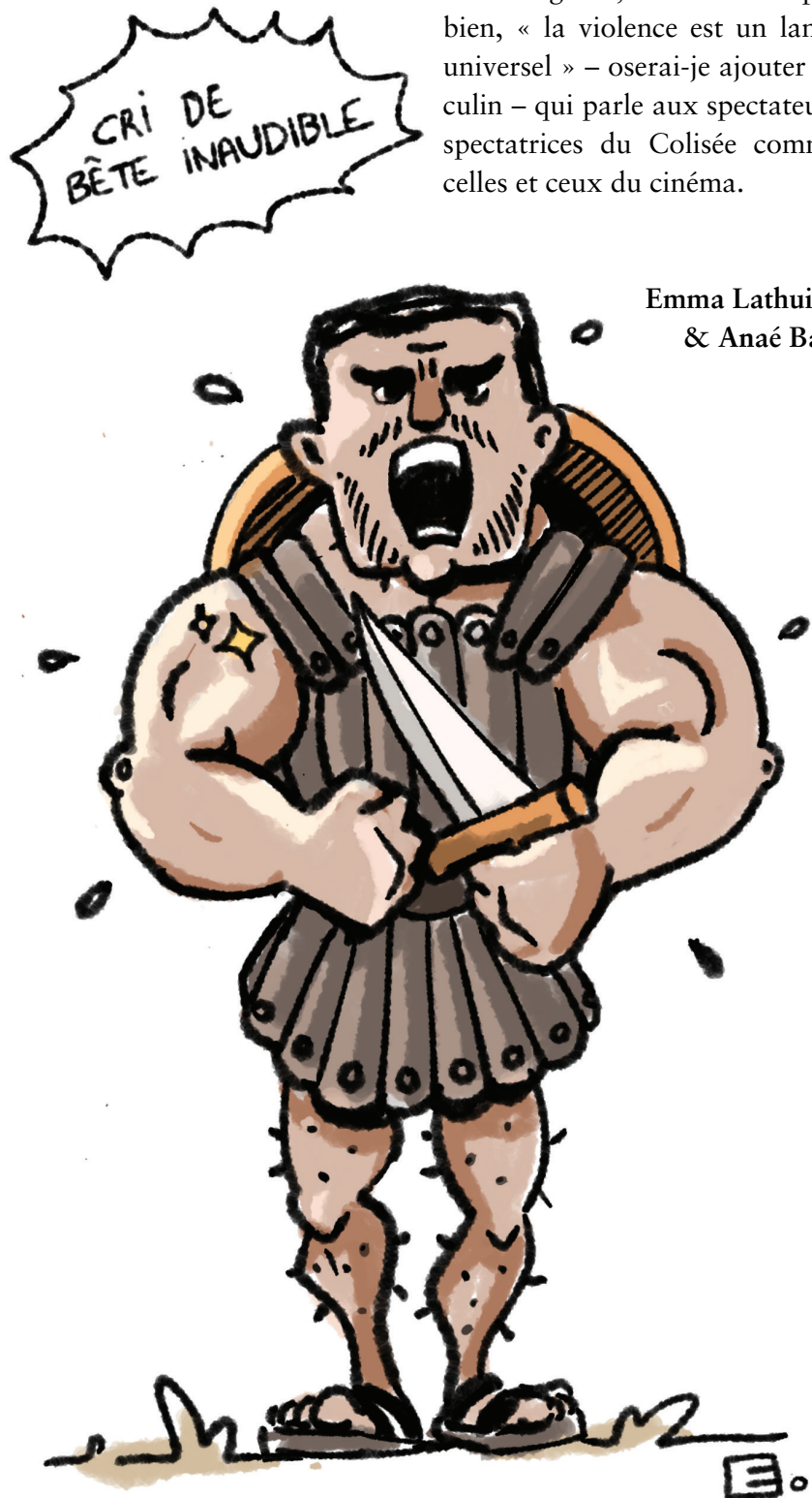
Illustration : Elsa Voltee