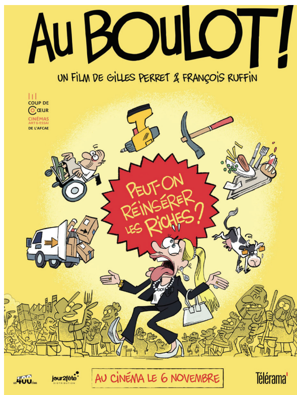
Au Boulot ! de Ruffin et Perret.

G. F : Un peu par connaissance, un peu avec un copain, et puis au fur et à mesure du film. Au début, on parlait de la question du salaire. C'est facile à déminer après une demi-journée à l'usine à poissons. Ensuite, on a creusé la question des “assistés”, ce qui nous a conduit au Secours Populaire ou territoire Zéro Chômeur. On voulait aussi aller à Grigny, la ville la plus pauvre de France. On fait en fonction.