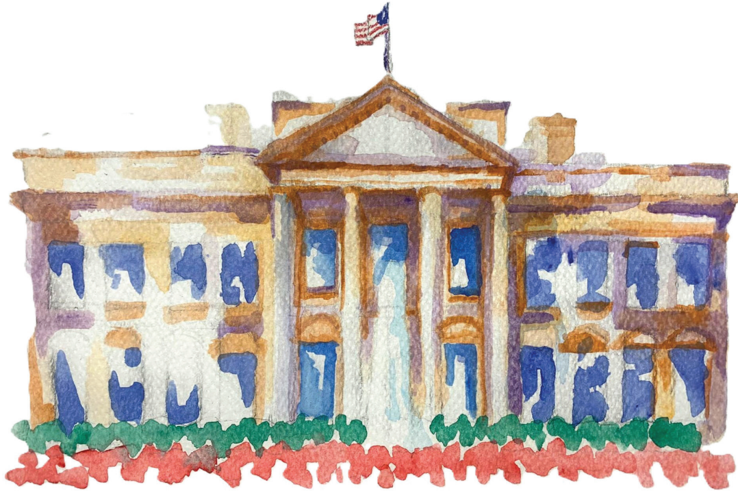
Illustration : Thimothée Thieulin.

la logique des partis”, abonde un étudiant. Malgré tout, l’identification partisane demeure pour les Américains un moyen de se définir : “Je connais des Américains très religieux qui fréquentent des étudiants internationaux tous les jours”, s’épanche Ren, “Même s’ils ne l’aiment pas, ils ont voté pour Trump. J’ai été choqué par le fait qu’ils ne votent pas pour des motifs économiques, mais par pur conservatisme.”