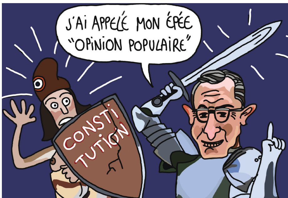
Illustration : Paul Klein

pays occidentaux que même la droite classique contribue à cet élargissement. En France, M. Wauquiez s'est fait le relai « présentable » de la délégitimation du Conseil d'État, sans parler de notre pitoyablement dangereux ministre de l'Intérieur. Au Royaume-Uni, le Parti conservateur s'en est violemment pris à la Cour suprême pour avoir rejeté leur plan de « remigration » au Rwanda.