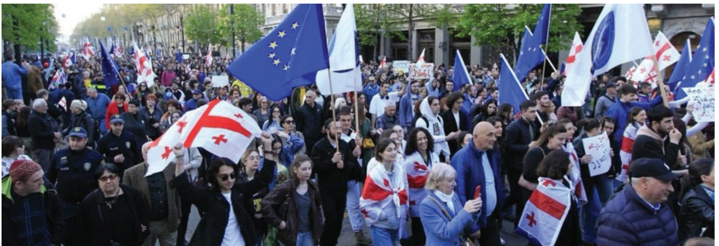
L'opposition pro-européenne défile dans les rues de Tbilissi.