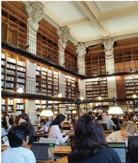
BU de la Victoire.

Sciences Po Bordeaux, ce sont des cours, une vie associative riche... Mais aussi pas mal de travail perso. Alors quoi de mieux pour préparer un galop d'essai de culture générale que de tester les meilleurs endroits pour bosser à Bordeaux ? Et comme je suis trop sympa, je me suis chargée de la mission pour vous.