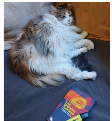
Hime, meilleure camarade de révision.