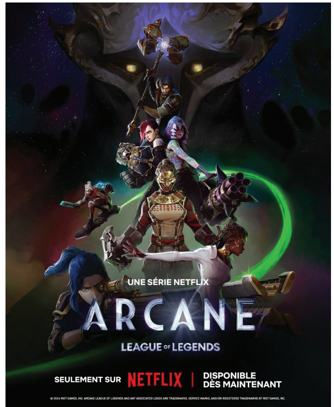
Série Arcane . Crédit : Allociné

Autre point positif de la série : il n'y a pas vraiment de véritables gentils ou de méchants. La plupart des personnages évoluent dans une zone grise et tentent de faire de leur mieux... sans forcément y parvenir. Jinx est sans doute le personnage aux émotions les plus complexes, dont les hallucinations peuvent aider le spectateur à mieux comprendre ses actions impulsives. Les autres personnages sont tout autant passionnants. Ekko, par exemple, qui semble faire l'unanimité, est qualifié de terroriste par Pilltover. Pourtant, c'est un véritable révolutionnaire qui cherche à améliorer le quotidien de son peuple et des compagnons. Viktor, un scientifique issu de Zaun venu à Pilltover, ou encore Mel, qui, en