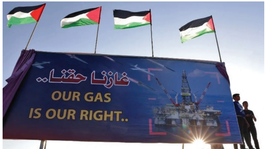
Un rassemblement palestinien dans le port de Gaza.

Outre un timing fort pressé (trois semaines seulement après le déclenchement du conflit avec le Hamas), la décision s'attire les foudres des ONG pro-palestiniennes, qui dénoncent une violation flagrante du droit international. D'une part, les licences empiètent sur les eaux souveraines gazaouies (la ZEE), pourtant reconnue par la Convention des Nations unies sur le droit de la mer. D'autre part, la Palestine est internationalement reconnue