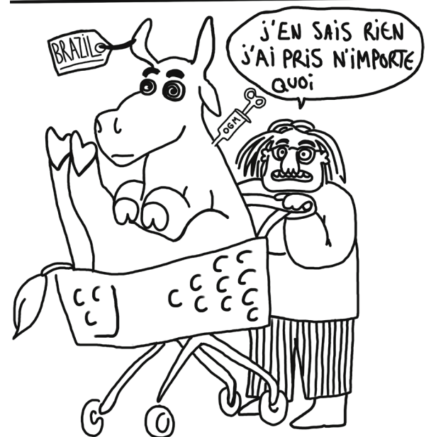
Illustration : Paul KLEIN

ACCORDS DU MERCOSUR: UNE SOLIDARITÉ DU CONSOMMATEUR FRANÇAIS POUR SES AGRICULTEURS?