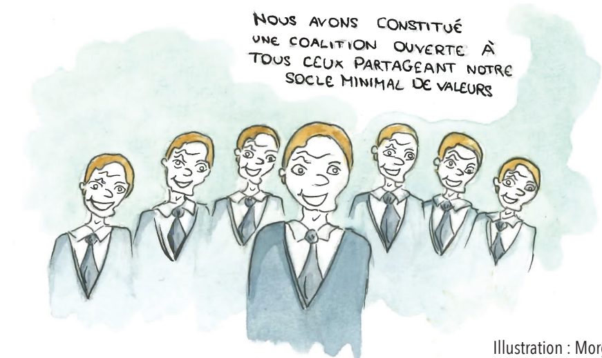
Illustration : Morgane.

Car la France est bien seule en Europe : si ce n'est en Grande-Bretagne, le scrutin majoritaire n'est utilisé nulle part ailleurs – la proportionnelle prévaut. Le