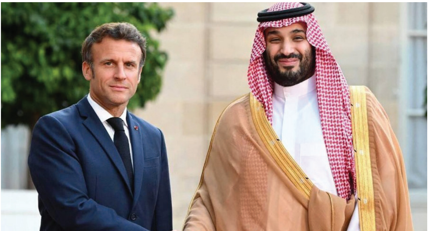
Emmanuel Macron accueillant le prince héritier saoudien Mohammed Ben Salmane à l'Élysée en 2022.

Mais réjouissons-nous : souvent (mais pas toujours), les tribunaux français et internationaux finissent par rappeler les potentats économiques à leurs responsabilités.