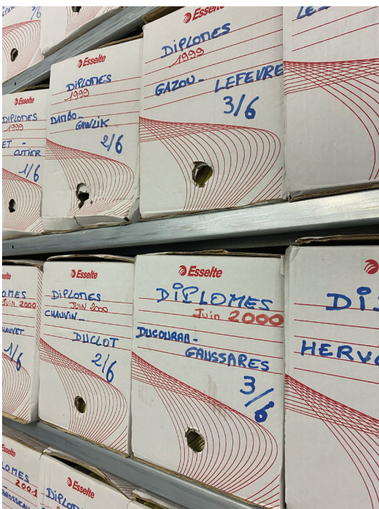
Les copies des diplômés 1999-2000, archivées.

Papiers, Pixels et Pandémie : comment le numérique redéfinit les archives ?