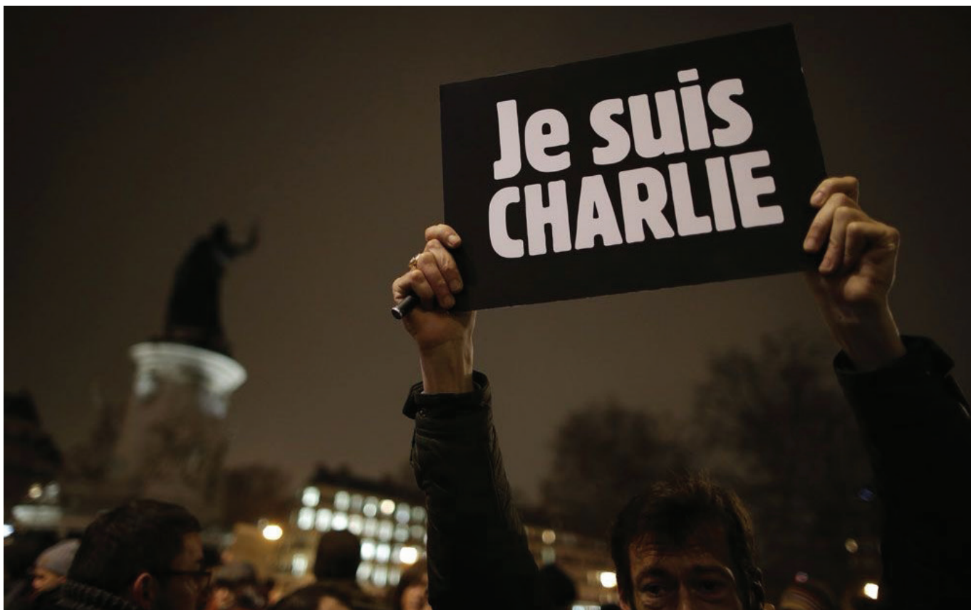
Affiche Je suis Charlie portée sur la Place de la République en janvier 2015.

liberté d'expression est un droit fondamental, la liberté de caricature en fait partie. » Un chiffre qui a augmenté de 18 points depuis 2012. Le combat est-il en train d'être gagné ? Hélas, pas chez les 18-30 ans, où un tiers « considèrent qu'on ne peut pas dire et caricaturer n'importe quoi sous couvert de liberté d'expression. » De même, 31 % des jeunes « pensent que Charlie Hebdo n'aurait pas dû publier ces caricatures. » Ce sondage remet en question l'ensemble du chemin parcouru en 10 ans et nous pose la question : sommes-nous encore Charlie ?