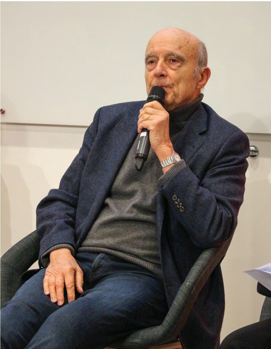
Alain Juppé lors de la conférence du Bureau des Médias.

AJ. — L'Europe est à la croisée des chemins. Nous ne sauvegarderons pas notre indépendance et notre souveraineté dans un cadre strictement national. Tous les défis que nous avons à relever, le défi climatique, qui n'a pas disparu, même si l'euroscpticisme revient à la mode ; le défi démographique, et les questions migratoires qui y sont liées ; le défi numérique, avec les promesses extraordinaires de l'intelligence artificielle, mais aussi ces menaces tout à fait considérables ; tout cela, nous ne pourrons le gérer qu'au niveau européen.