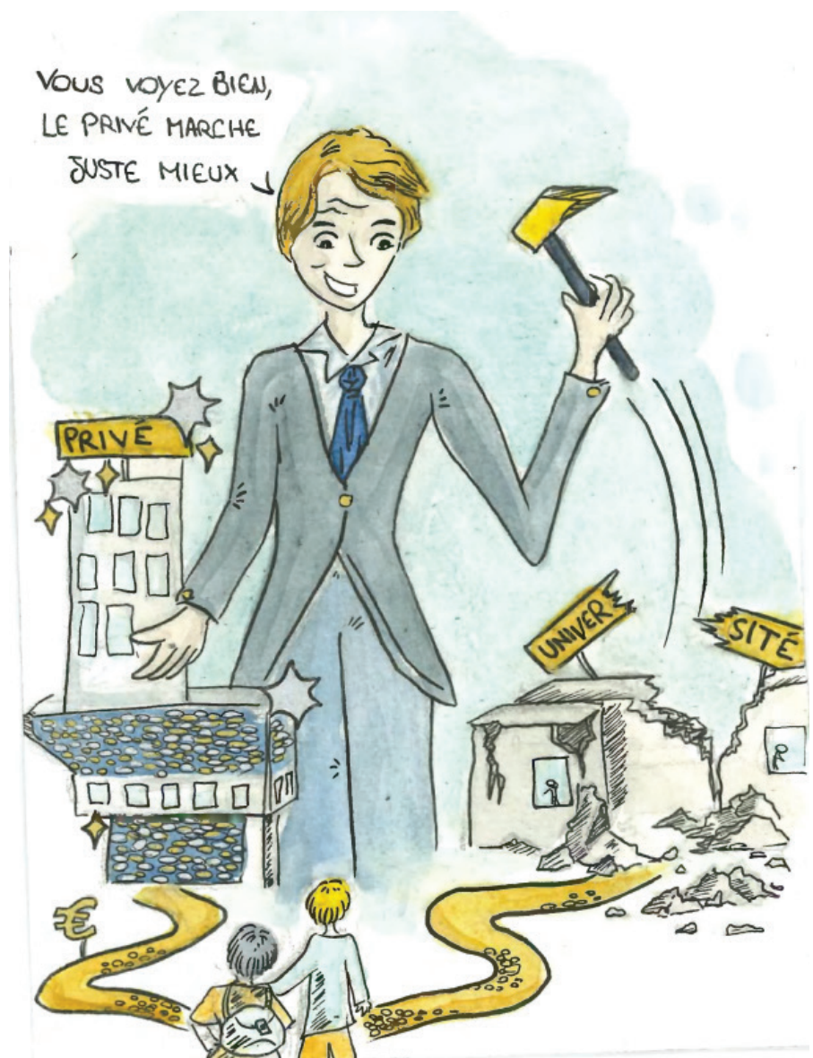
Illustration : Morgane PERRIER