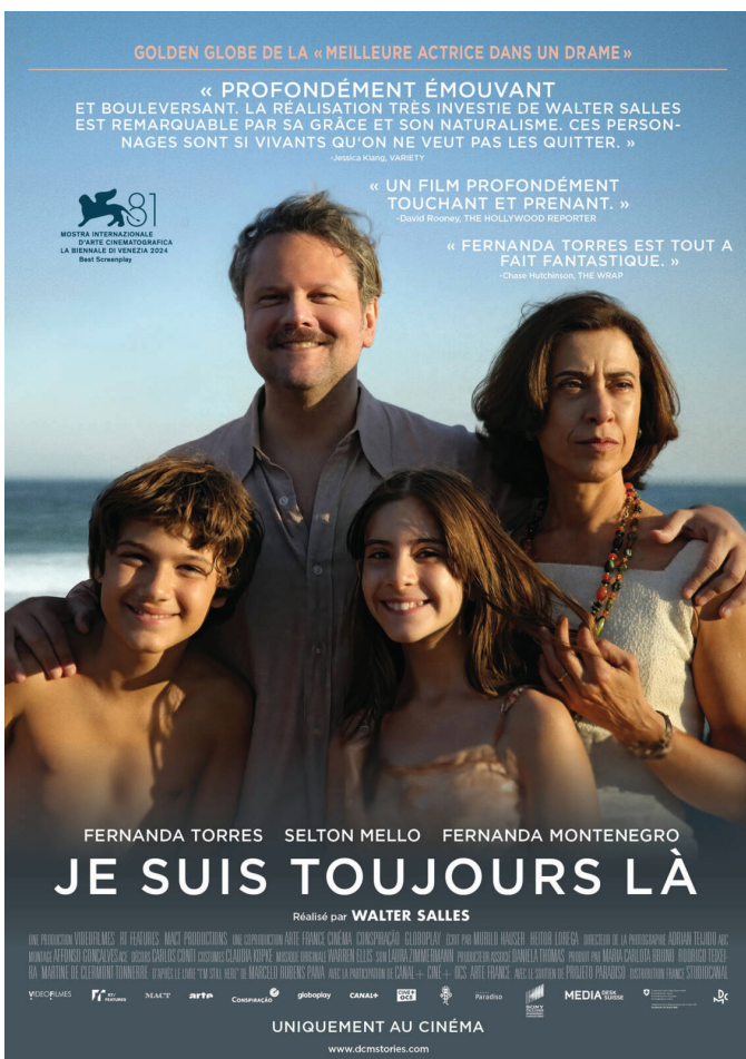
Affiche Je suis toujours là .