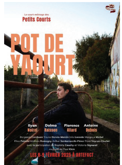
"Pot de Yaourt".