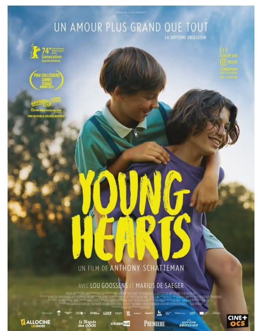
Affiche de Young Hearts .