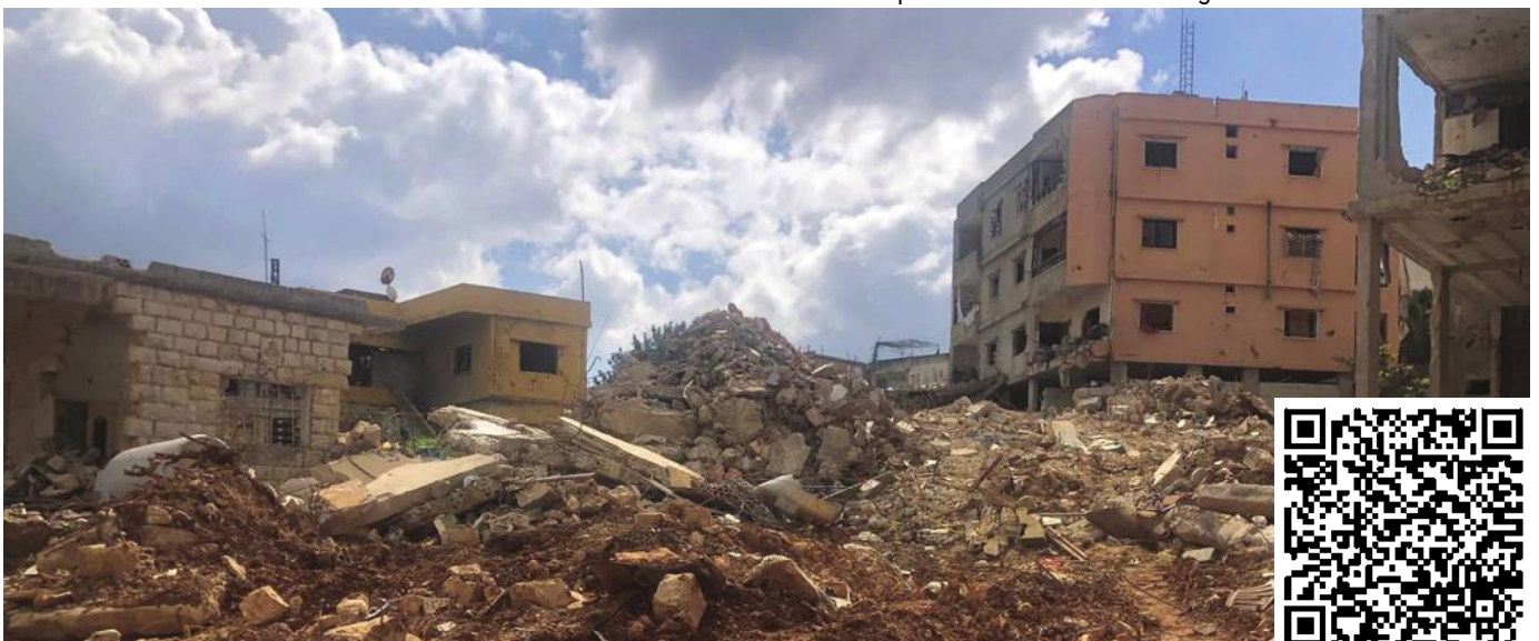
Village du Sud-Liban où Hala Gharib a grandi.

L'article complet est à retrouver en intégralité sur notre site Internet.