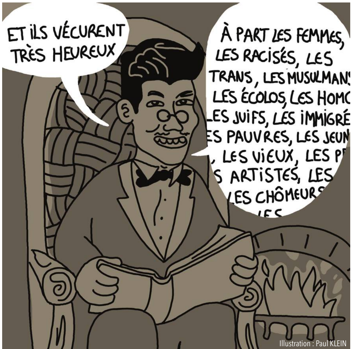
Illustration : Paul KLEIN