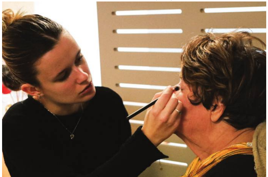
Séance de maquillage avec En Cannes.

En deux ans, l'association a réalisé près de 10 ateliers, le plus souvent en partenariat avec d'autres associations de l'IEP.