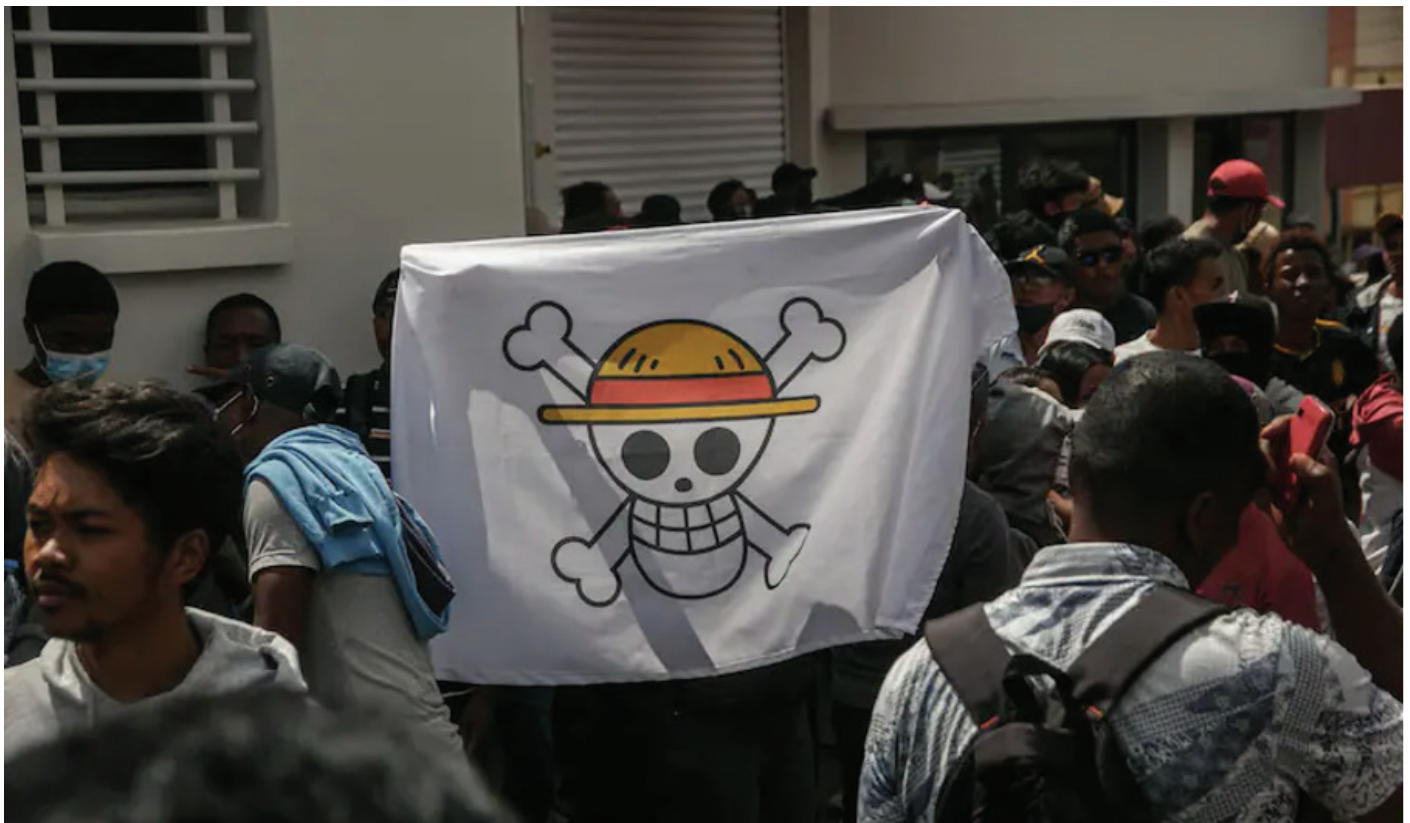
A Antananarivo, la capitale de Madagascar, le 30 septembre.