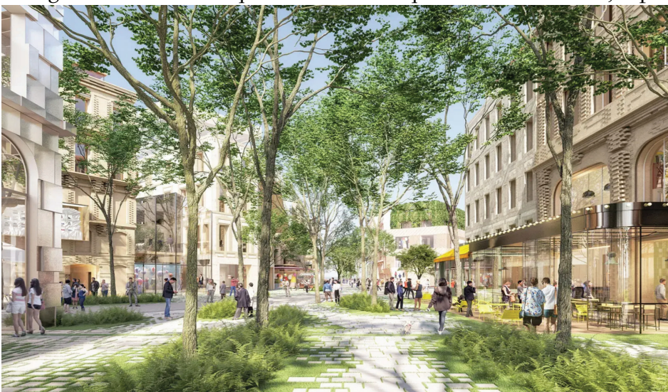
Le cours Saint Jean.

Finalement, ce nouveau quartier a pour ambition d'offrir un nouveau pôle dynamique à l'extérieur du centre-ville, alliant urbanisme écologique, commerces équitables et stimulation économique. Cette transformation impactera probablement les quartiers alentours, en com-