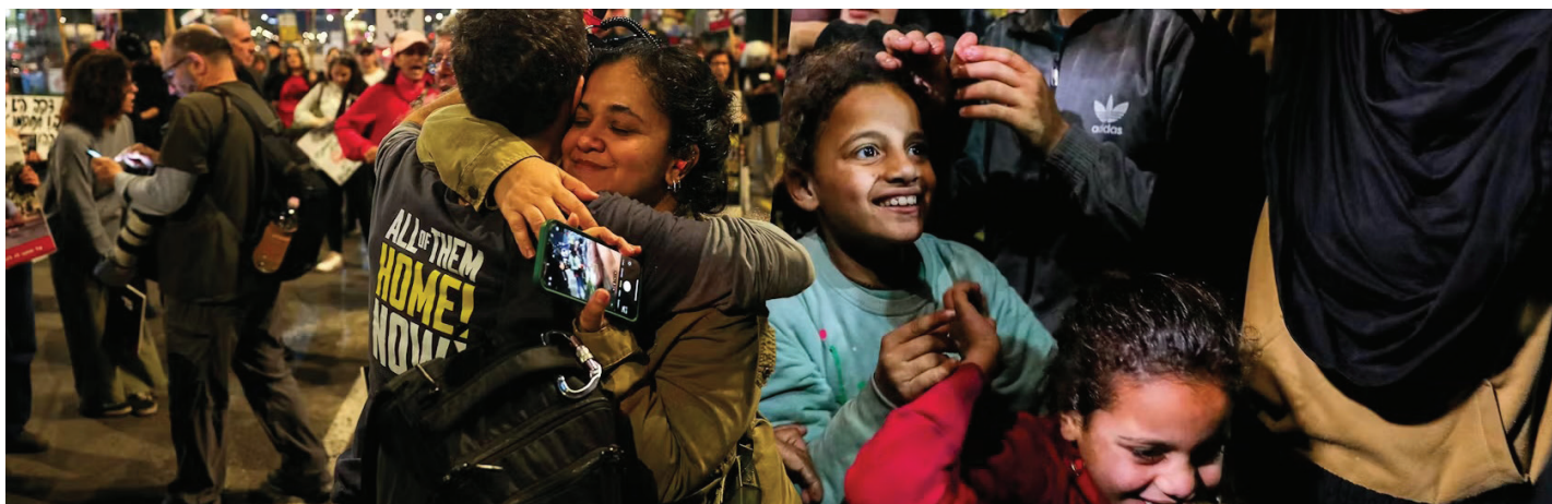
Scènes de liesse à Tel-Aviv (à gauche) et à Gaza (à droite).