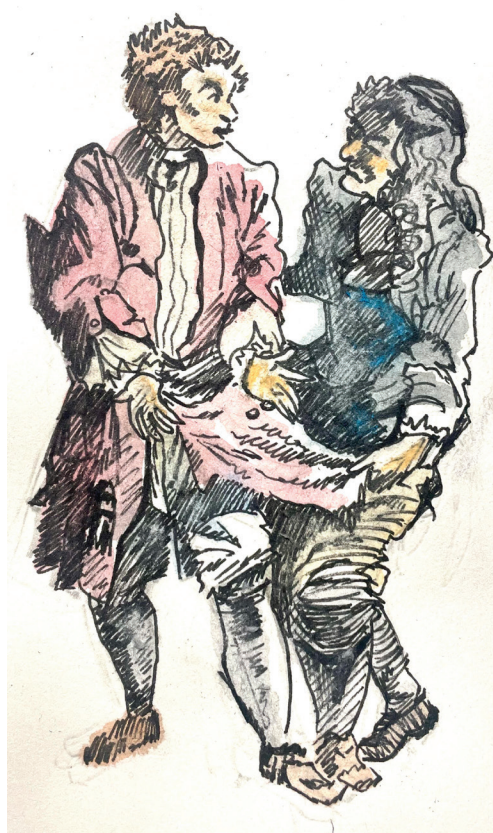
Illustration : Thimothée

Dans ce contexte difficile, Gaëlle Seguin-Périn rappelle combien la